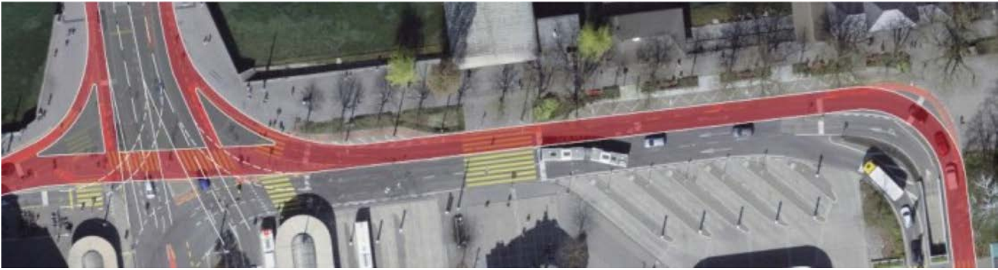
Skizze von Zweirichtungsveloweg um den Bahnhofplatz mit zwei statt drei MIV-/Busfahrspuren

Erfreulich ist, dass der Kanton bei der Radverkehrsanlage Götzentalsstrasse auf einen Einsprachepunkt von Pro Velo Luzern eingeht und die Projektierung der Verlängerung des Rad-/Gehweges angegangen ist.